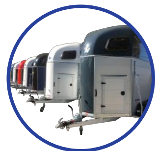
📍 Moderne Polyhaube, mögliche Farben: RAL-Palette