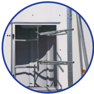
📍 große Sattelkammer mit dreh- und schwenkbaren Sattelhalter