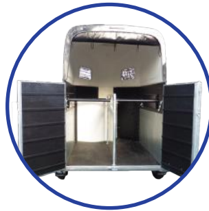
📍 Rampe & Tür Kombination 2-teilig