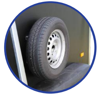
📍 Ersatzrad mit Ersatzradhalterung