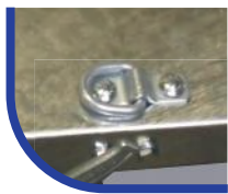
4 Stück aufgesetzte Anbinde Ringe