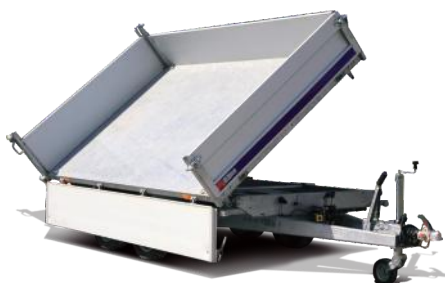
Verstärkte Qualitätsbereifung für die täglichen Aufgaben