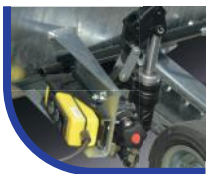
Kipphydraulik elektrisch gesteuert (E- Pumpe) und Handpumpe