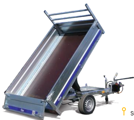
Stahl oder Alu – Bordwänden 40 cm