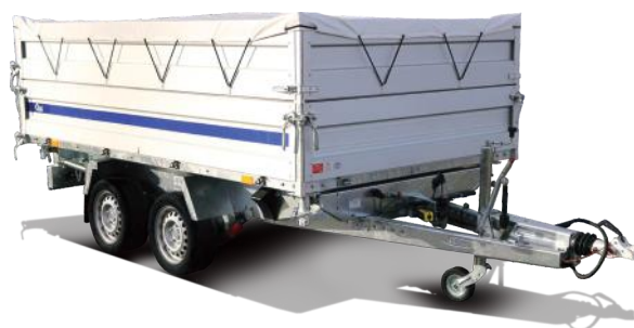
Bordwanderhöhung und Flachplane