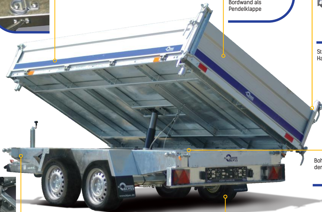
Bohlenschicht unter der Ladefläche