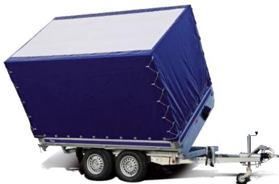
Plane & Spiegel